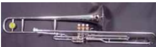
Trombone à pistons

Le trombone à pistons a un registre comparable à celui des trombones ténor, mais la coulisse est remplacée par trois pistons. Il dispose quelquefois de deux tubes amovibles interchangeables qui permettent de fixer sa fondamentale soit en si bémol soit en ut. L'articulation est différente, plus proche de celle de la trompette et il permet une dextérité difficile à obtenir avec une coulisse. Il est généralement considéré comme étant difficile à jouer juste, et est de moins en moins utilisé de nos jours.