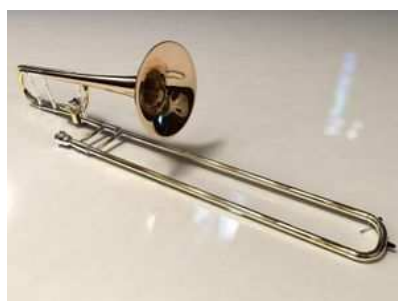
Trombone à coulisse

La longueur de l'instrument est modifiée par une coulisse qui peut être allongée ou raccourcie. La coulisse est divisée en plusieurs positions — jusqu'à sept pour le trombone ténor —. Elle est en 1 re position quand elle est entièrement rétractée, et en dernière position lorsqu'elle est au maximum de son élancement. Les positions ne sont pas repérées ou marquées mais évaluées par l'instrumentiste. Accroître la longueur de la coulisse d'une position fait baisser la hauteur d'une note d'un demi-ton.