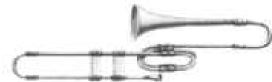
Gravure d'une sacqueboute

Les origines lointaines du trombone se trouvent probablement dans le buccin, sorte de tuba joué par les romains, dont il existait une variante en forme de « S » rappelant celle du trombone actuelle – le terme buccin fut d'ailleurs repris au XIX e siècle pour désigner un trombone d'orchestre militaire dont le pavillon représentait une tête de serpent.