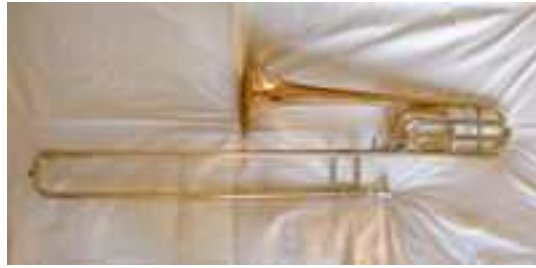
Trombone ténor complet