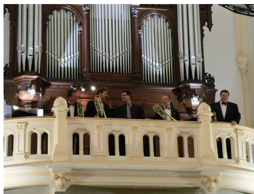
Marquette lez Lille 2005