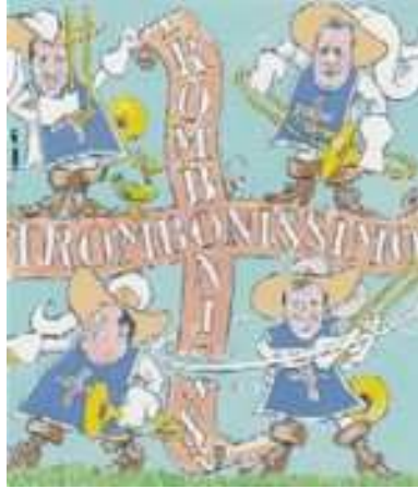
Caricatures : Boss