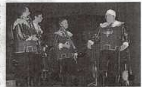
Le quatuor Trombonissimo a une fois de plus entraîné le public dans une histoire malicieuse.

Les spectateurs ont eu droit à un grand moment de spectacle tout au long de ce conte qui leur a permis de voyager à travers toute la famille des trombones : saqueboute, trombone à piston, trombone basse et trom-