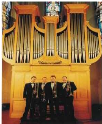
quatuor de trombone et orgue 1999